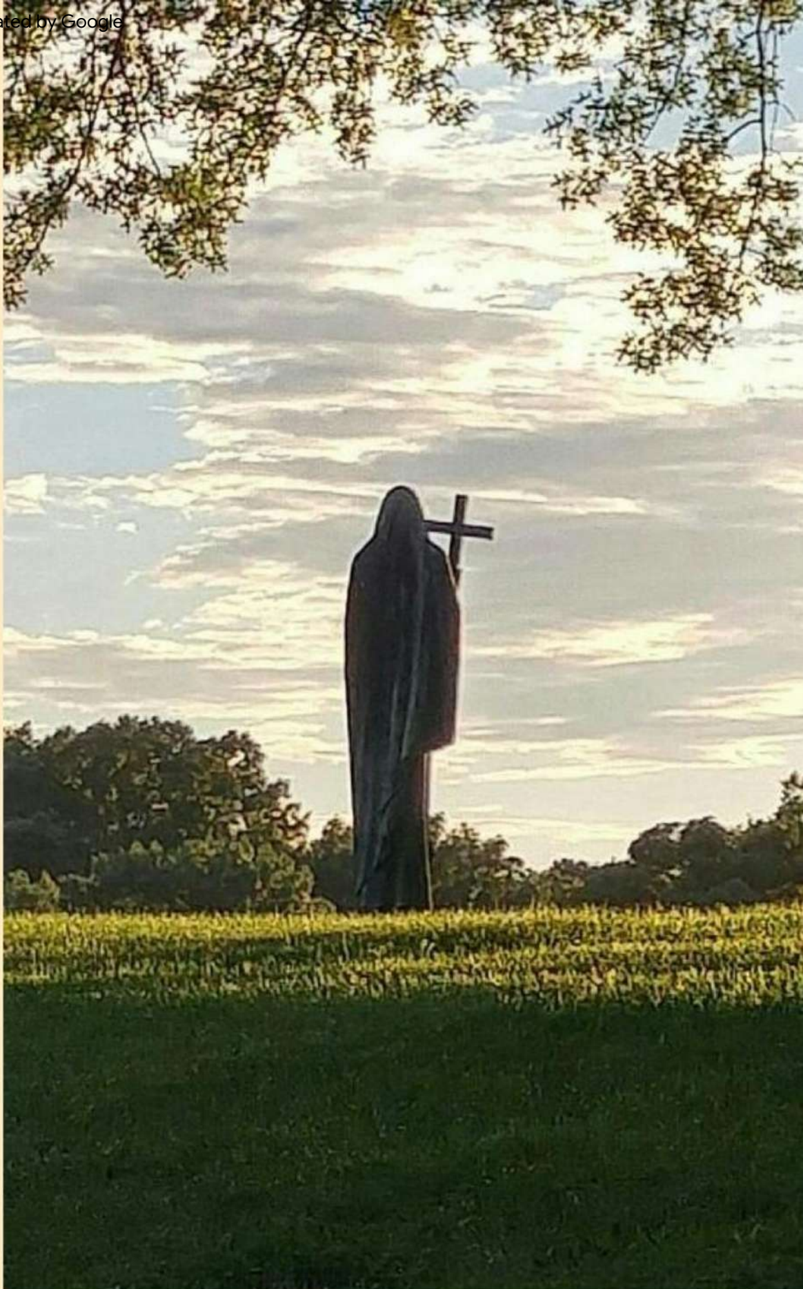
Foto de arriba tomada durante la Caminata del Rosario en

Cementerio de Todos los Santos en North Haven