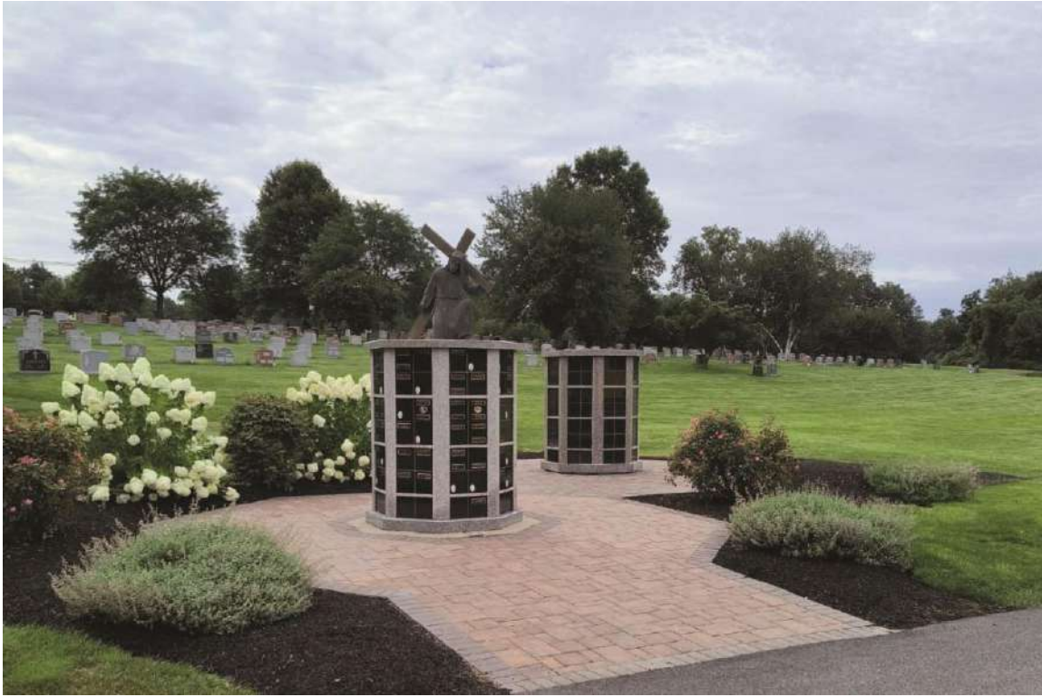
Un nuevo columbario (arriba) en Cementerio de San Juan