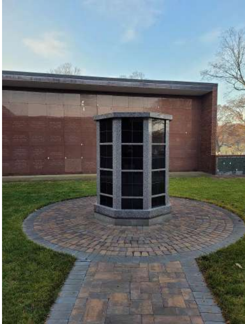
Cementerio de San Lorenzo