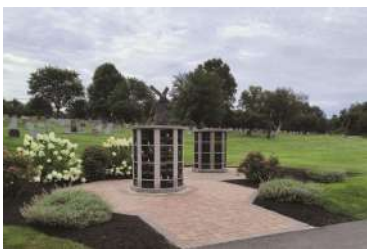
Fincas semiprivadas del cementerio de St. John en santa cruz