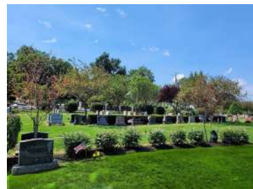
Nuevo monumento las secciones son disponible en Cementerio del Calvario

Visite West Haven y Waterbury para ver nuestra NUEVO Columbario